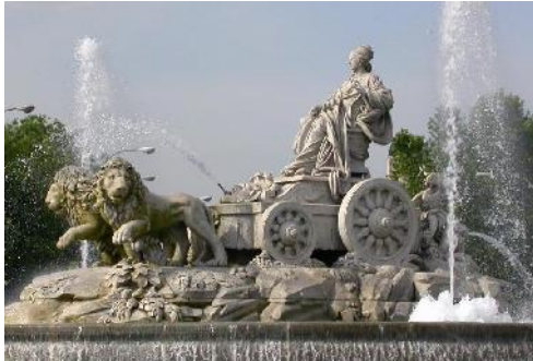
Fuente de Cibeles Paseo del Prado