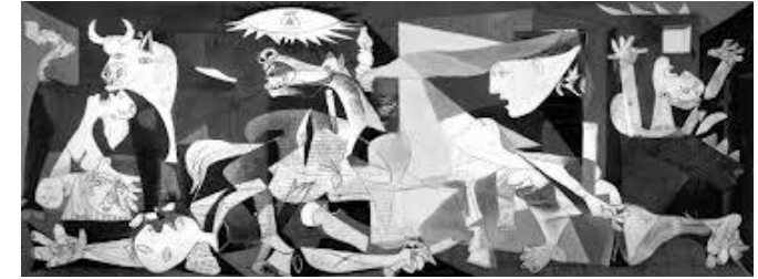
Guernica (Picasso, 1937)