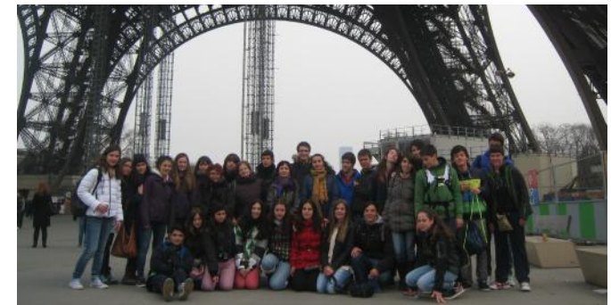
Alumnos españoles en París.