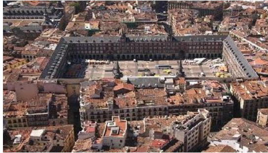
Vista aérea de la Plaza Mayor de Madrid

Comida en la explanada del Templo de Debod