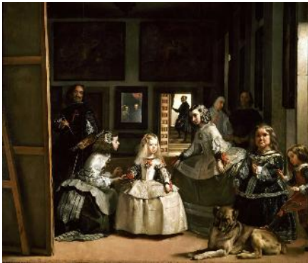
Las meninas (Velázquez, 1656)

18.00 h. Traslado en autocar desde el Museo del Prado a Pozuelo de Alarcón.