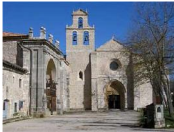
Monasterio de San Juan de Ortega