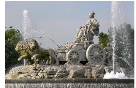
Fuente de Cibeles

Museo Reina Sofía Parque del Retiro Plaza de Cibeles Puerta de Alcalá