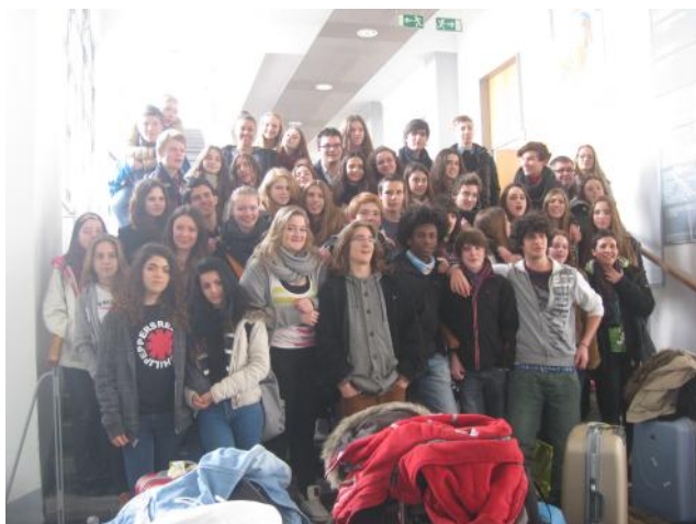
Alumnos españoles y franco-alemanes en Sarrebruck.

13.30 h. Comida de despedida de los alumnos y profesores franco-alemanes en el IES Gerardo Diego.