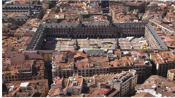
Vista aérea de la Plaza Mayor de Madrid

18.30 h. Llegada de los alumnos a Pozuelo.