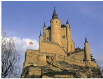
Alcázar de Segovia

Acueducto Plaza Mayor Barrio de la Judería Alcázar