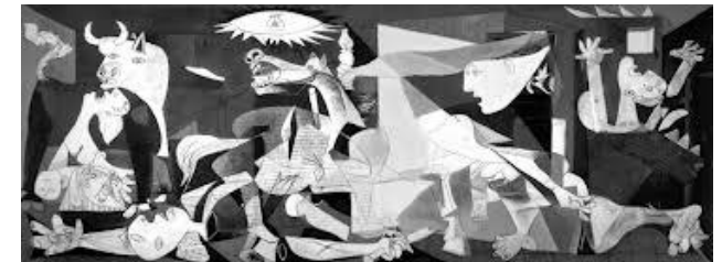
Guernica (Picasso, 1937))

18.30 h. Llegada de los alumnos a Pozuelo.