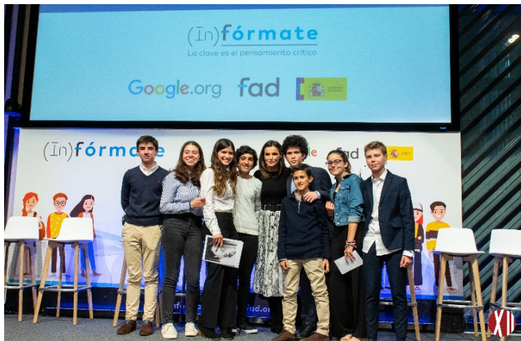
S.M la Reina con representantes de clubs de debate DOCE de los IES García Lorca, Carmen Conde y Margarita Salas

Este año, alumnos de 3 de nuestros centros colaboraron con Google y la Fundación de Ayuda contra la drogadicción , que promueve la educación en valores. nuestro país, participaron en un proyecto sobre pensamiento crítico debatiendo ante S.M la Reina Letizia y la ministra de Sanidad .